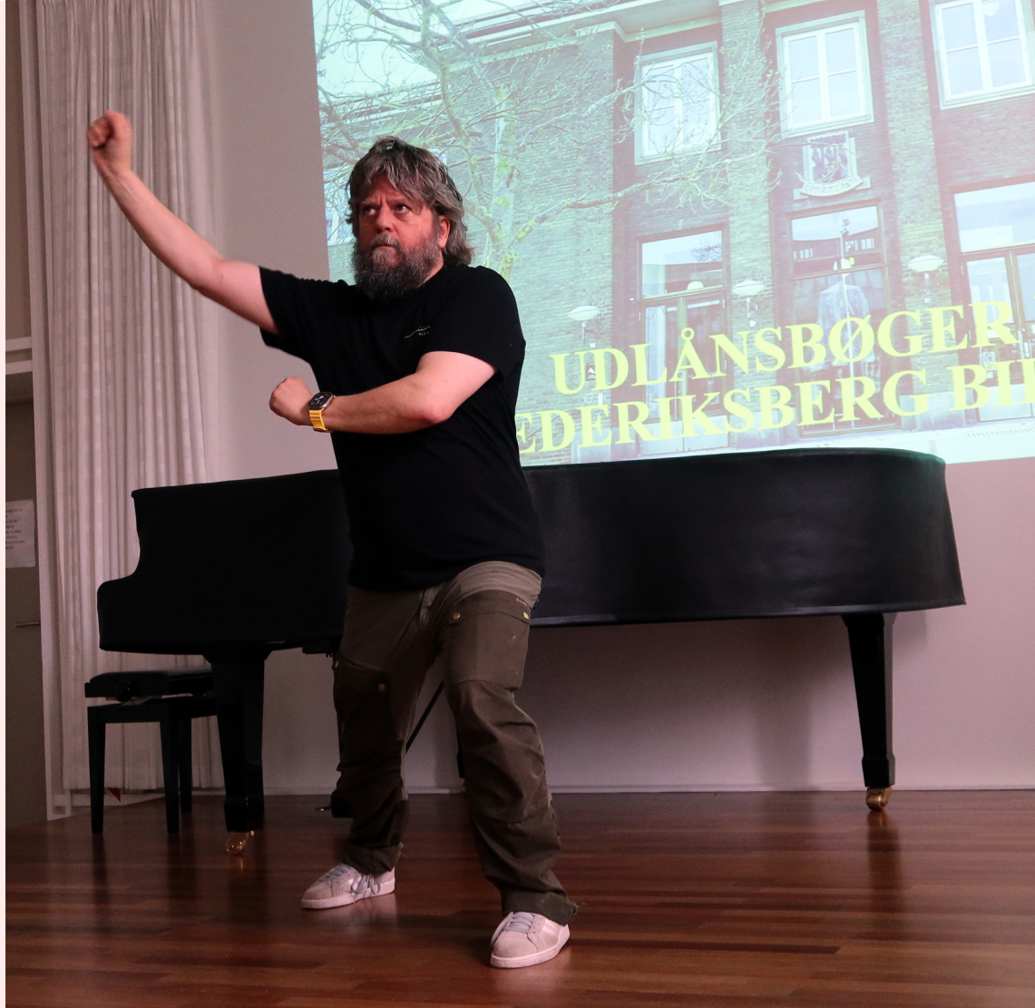
Anders Lund Madsen danser "Borte Med Blæsten"

Grunden til Anders Lund Madsens store fascination af den håbløse fugl er, som han sagde, at der er altid andre, der har det værre end en selv, og det mener han absolut, hoatzinen må have.